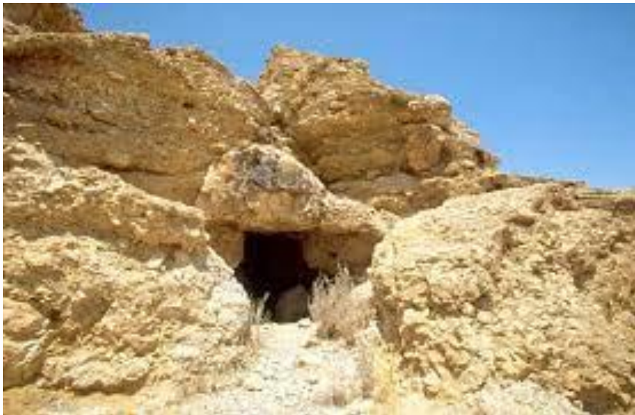
De grot van Machpela.

Toen vader Jacob zijn zonen alle twaalf een zegen had gegeven was hij erg moe. Ze zagen hoe zijn ogen al zwakker werden. Maar toch wilde hij hun nog één ding zeggen: ‘Begraaf mij bij mijn voorouders, in de grot van Machpela, bij Mamre in Kanaän. Daar hebben mijn broer Ezau en ik onze vader Izaäk begraven en daar liggen ook mijn grootouders Abraham en Sara. Ook mijn moeder Rebekka en mijn vrouw Léa.