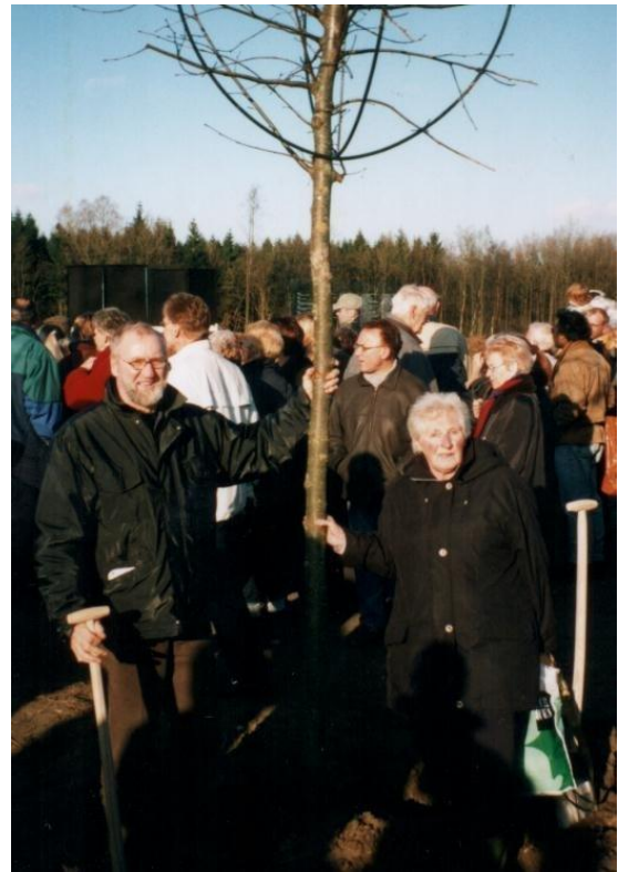
De man van de mevrouw, met wie ik de herdenkingsboom voor de provincie Groningen mocht planten, was ook aan kanker overleden.