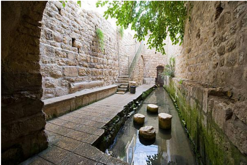
De vijver van Siloam in Jeruzalem.

‘Was u maar blind,’ zei Jezus, ‘dan zou u bij Mij komen en Ik zou u de ogen openen en uw zonden vergeven. Maar nu jullie denken, dat jullie zien, nu is er voor jullie geen genezing en blijven jullie verkeerde dingen doen.’