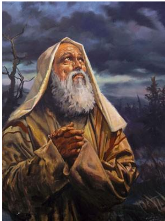
Barnabas, geboren en getogen op het eiland Cyprus

Ze hadden geen geschikter persoon kunnen vinden dan deze Barnabas. Niet alleen was hij een man, net zoals Stefanus, met een sterk geloof en vol van de Heilige Geest, maar omdat Barnabas afkomstig was van Cyprus, kon hij zich beter inleven wat deze jonge gemeente nodig had. Hij kende hun problemen. Hij wist van hun strijd en begreep hoe moeilijk het was om met hun oude heidense leven te stoppen en zich volledig aan Jezus toe te vertrouwen.