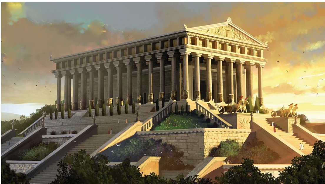
De tempel van Artemis

Ook in Efeze waren in die tijd grote tempels van Griekse en Romeinse goden. De mooiste van allemaal was de tempel van de godin Artemis. In deze tempel stond een beeld dat volgens de priesters uit de hemel was gevallen. Deze tempel van Artemis was een erg groot gebouw. Hij was meer dan honderd meter lang en zeventig meter breed. Van grote afstand zag je al de honderdachtentwintig grote pilaren, die twintig meter hoog waren.