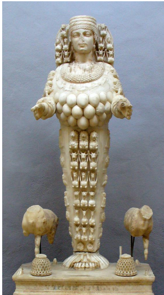
Beeld van Artemis.

waarheid. Niemand kan dat ontkennen. Daarom moeten jullie kalm blijven en geen domme dingen doen.