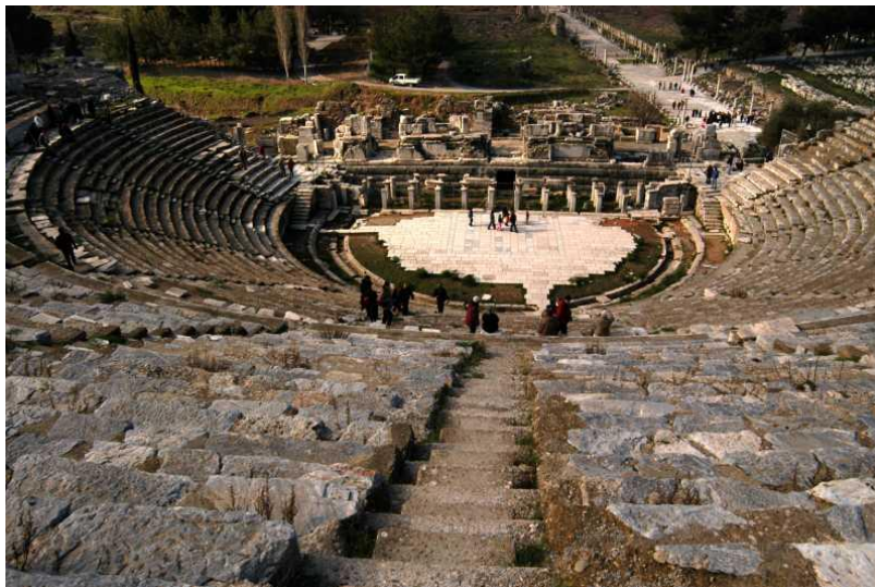
De schouwburg in Efeze

Nu was het juiste moment voor de stadsschrijver gekomen. Met een paar lenige stappen stond hij op het podium, hoog boven het gewone volk. Hij stak zijn hand omhoog en direct vielen al die schreeuwende monden dicht. Ze keken hem verwachtingsvol aan. Het was alsof ze blij waren dat er nu een einde gekomen was aan hun onzinnig geschreeuw. Dat ze nu weer een leider hadden naar wie ze konden luisteren. Op dat moment wist de stadsschrijver dat hij het van het volk gewonnen had. Hij haalde diep adem en begon te spreken. Na al dat geschreeuw klonk zijn stem ver en duidelijk in die vreemde stilte.