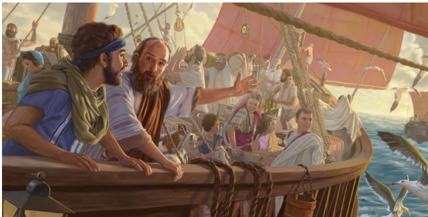
Paulus neemt afscheid en vaart verder richting Jeruzalem

Toen Paulus klaar was met zijn toespraak, knielde hij om samen met hen te bidden. Daarna werd hij één voor één door iedereen omhelsd en kreeg een afscheidskus.