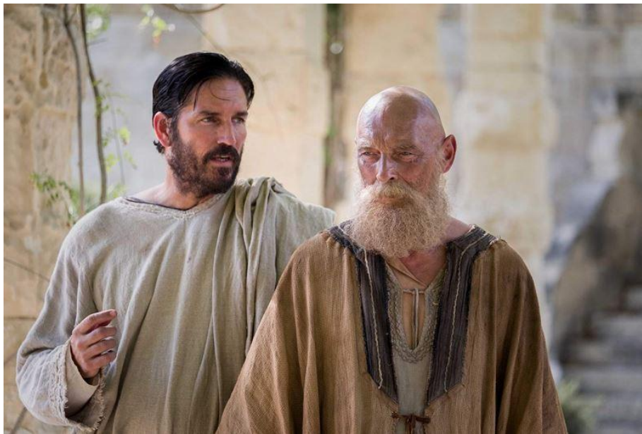
Paulus en zijn vriend Titus.

Met deze brief ging Titus terug naar Korinte. Daar kon hij dan ook een collecte organiseren voor de Christengemeente in Jeruzalem. Om die reden gingen met Titus nog enkele broeders mee. Paulus zou hen volgen, zodra hij kon.