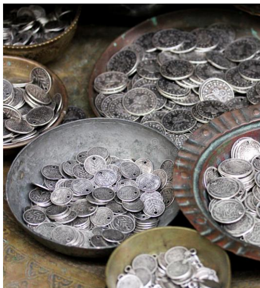
Geld voor de noodlijdende kerk in Jeruzalem.

Toen het schip aanlegde stapte Paulus direct aan boord. Behalve zijn vrienden Lucas en Timoteus waren er nog een paar anderen. Met elkaar voeren ze naar Jeruzalem om daar de opbrengst van de collecte te brengen. Deze was gehouden in Asia en Griekenland voor de noodlijdende kerk in Jeruzalem.