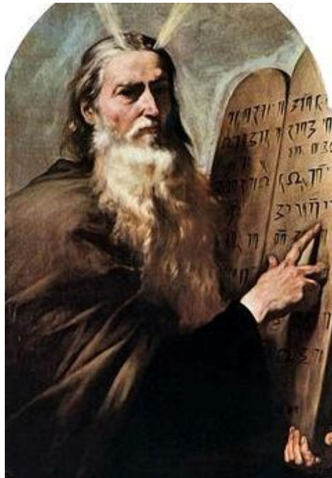
De wetten van Mozes.

En Paulus? Wat leerde hij zijn nieuwe gemeenten in het verre buitenland? Jacobus begreep wel dat die bekeerde heidenen zich niet aan de wetten van Mozes konden houden. Maar hoe dachten de andere leden van de gemeente in Jeruzalem hierover? Zou hierover een groot meningsverschil ontstaan met als gevolg een eerste kerkscheuring?