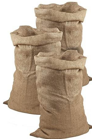
Zakken vol met geld

Maar lang duurde hun dankwoord niet. Eerst moest er gesproken worden over de wetten van Mozes! Hoe dacht Paulus hierover? Wat was in dezen zijn mening? Deze vragen waren voor hen heel erg belangrijk!