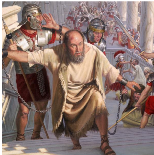
Paulus gevangen genomen door Romeinse soldaten.

Wild renden ze in grote woede achter de soldaten aan en ze probeerden de soldaten de weg bij de trap omhoog, te versperren. Maar ze waren te laat. De soldaten waren het eerst bij de trap. Maar de Joden drongen zo tegen de soldaten aan, dat ze Paulus optilden en hem boven hun hoofden naar de trap tilden. Toen Paulus veilig naar boven was gegaan, stond hij op het plein van de Antoniaburcht naar beneden te kijken en hoorde hij het geschreeuw en gekrijs van de menigte: ‘Weg met Paulus! Aan het kruis met hem! Hij heeft de dood verdiend!’