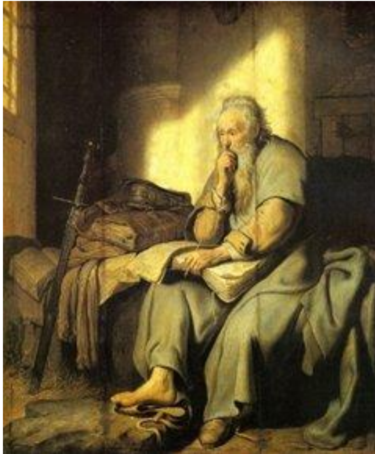
Paulus in de gevangenis

Dit was een bittere teleurstelling voor Paulus. Maar hij wist dat God het goed met hem zou maken, op Zijn tijd. Zou hij als een gevangen man zijn reis naar Rome moeten maken?