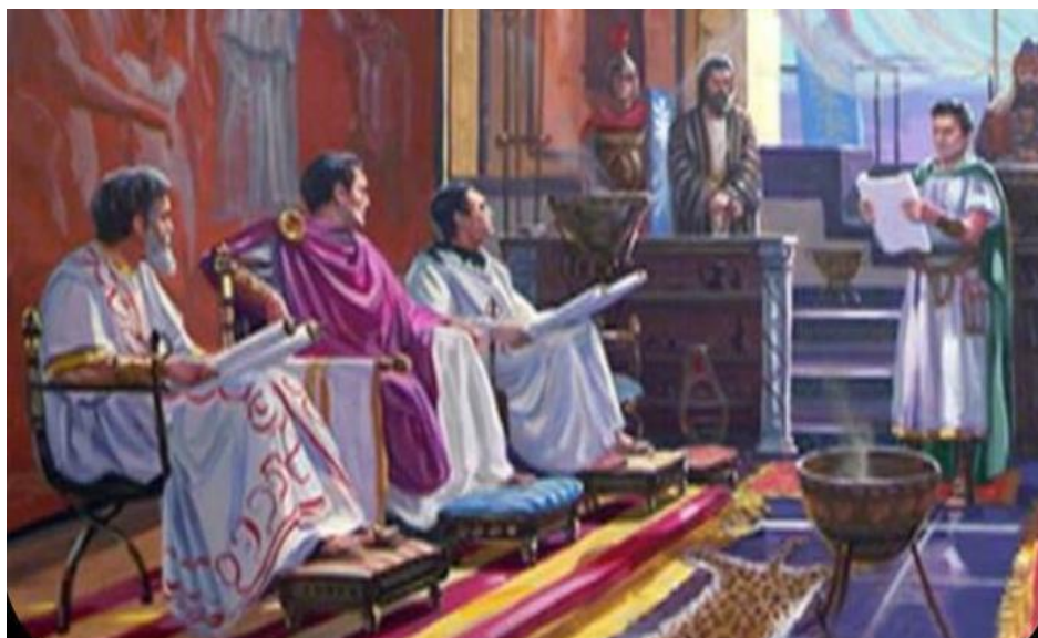
Advocaat Tertullus spreekt....

'Geachte heer Felix, dankzij u is er al lange tijd vrede in ons land. U neemt beslissingen die goed zijn voor ons volk. Dat weten wij en daar zijn wij u heel dankbaar voor. Wilt u vandaag zo vriendelijk zijn om een ogenblik naar ons te luisteren? Ik zal het kort houden.'