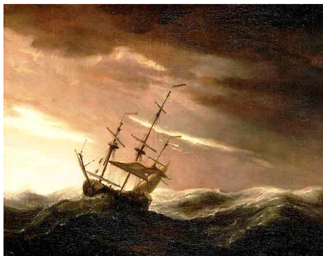
Een hevige storm overviel het schip.

Maar een paar uren later lachten de matrozen niet meer. Boven de bergen van het eiland Kreta hingen dreigende donkere wolken. In korte tijd was de hele lucht donker geworden. Op dat moment was het doodstil. De zeilen hingen slap naar beneden. De schipper keek ongerust naar de dreigende lucht. De centurio dacht aan de woorden van Paulus. De matrozen klommen in de touwen en rolden in alle haast de zeilen op. Ze stonden nog maar net weer op het dek of vanaf het eiland overviel de stormwind het schip.