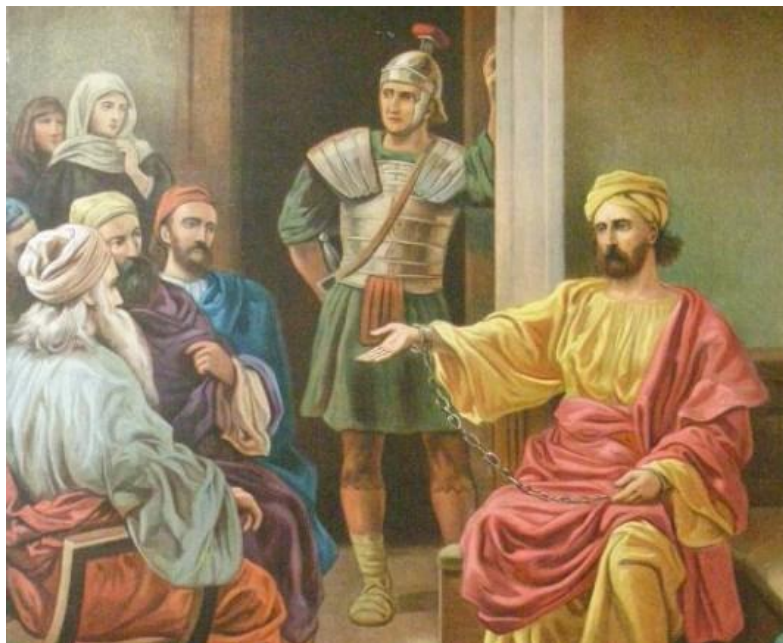
Paulus, een 'Jood-in-boeien'.

Omdat Paulus niet wist of deze belangrijke Joden in Rome door het Sanhedrin in Jeruzalem over hem geïnformeerd waren, vertelde hij hun eerst de reden waarom hij zich op de keizer had beroepen. Ze mochten eens denken, dat hij zijn eigen afkomst verloochende en zijn eigen volk niet meer belangrijk vond.