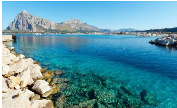
Het eiland Sicilië

Het weer werkte van alle kanten mee en al heel snel waren ze in de havenstad Syracuse, op het eiland Sicilië.