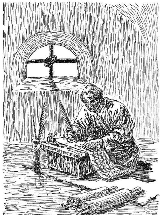
Paulus in de gevangenis