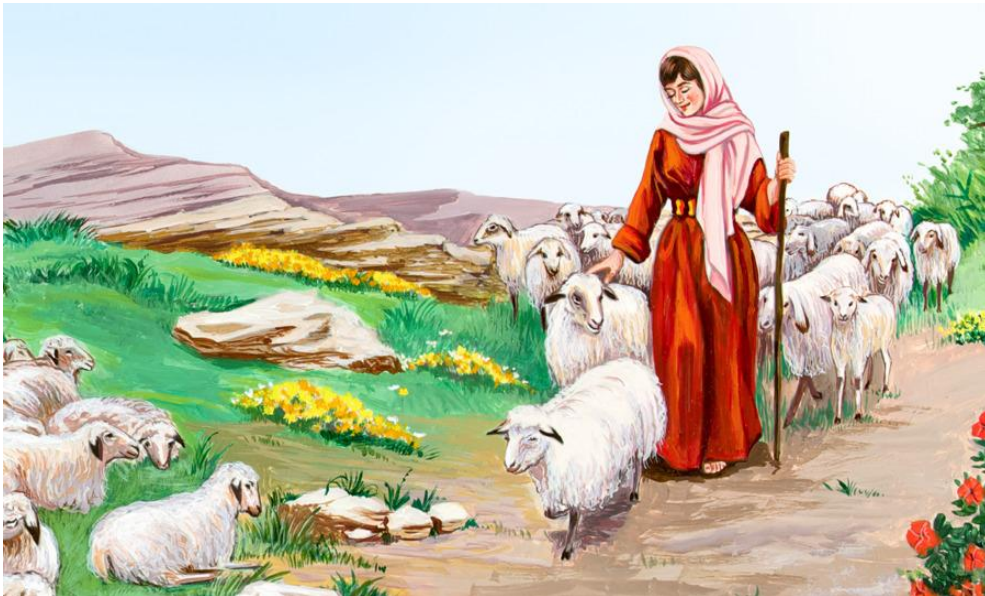
Jacob en Rachel, liefde op het eerste gezicht.

Enige tijd later gingen ze op reis naar Bethel, waar onderweg zijn vrouw Rachel stierf. Dat was op de dag dat haar tweede zoon Benjamin geboren werd. Jacob dacht niet meer aan de jaloezie van zijn andere zonen, de halfbroers van Jozef en Benjamin. Hij had alleen nog maar verdriet om Rachel. Was het een wonder dat hij nog meer van Jozef ging houden? Als hij hem zag lopen in zijn prachtige bontgekleurde mantel, dan was het net alsof hij Rachel op zich toe zag komen lopen, op die dag dat hij haar voor de eerste keer zag. Ja, dat was lang geleden, daar bij die waterput. Hij was direct smoorverliefd op haar geworden. En geen dag had hij daar spijt van gehad.