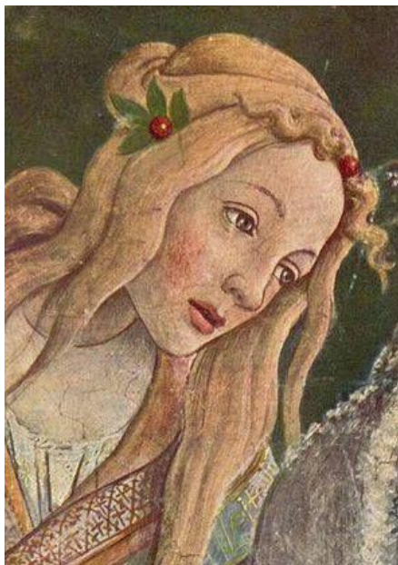
Mozes trouwt met Zippora, één van de dochters van Jetro.

Toen Mozes een aantal dagen bij priester Jetro te gast was geweest vroeg deze hem of hij niet wilde blijven. Dan kon hij overdag de schapen hoeden en als hij wilde, mocht hij wel met één van zijn dochters trouwen. Er waren er zeven. Hij hoefde alleen maar te zeggen wie hij de liefste vond.