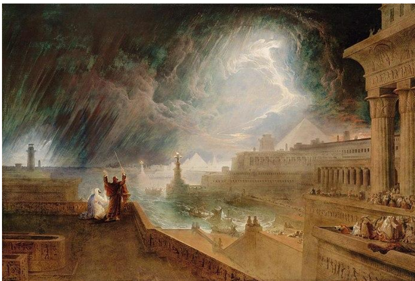
Zevende plaag: Hagelbuien

De volgende dag op hetzelfde tijdstip stond Mozes in het open veld en stak zijn staf omhoog. Aan de horizon zag hij direct onweerswolken aankomen. De blauwe lucht werd razendsnel zwart en even later vielen de eerst hagelstenen uit de laaghangende wolken.