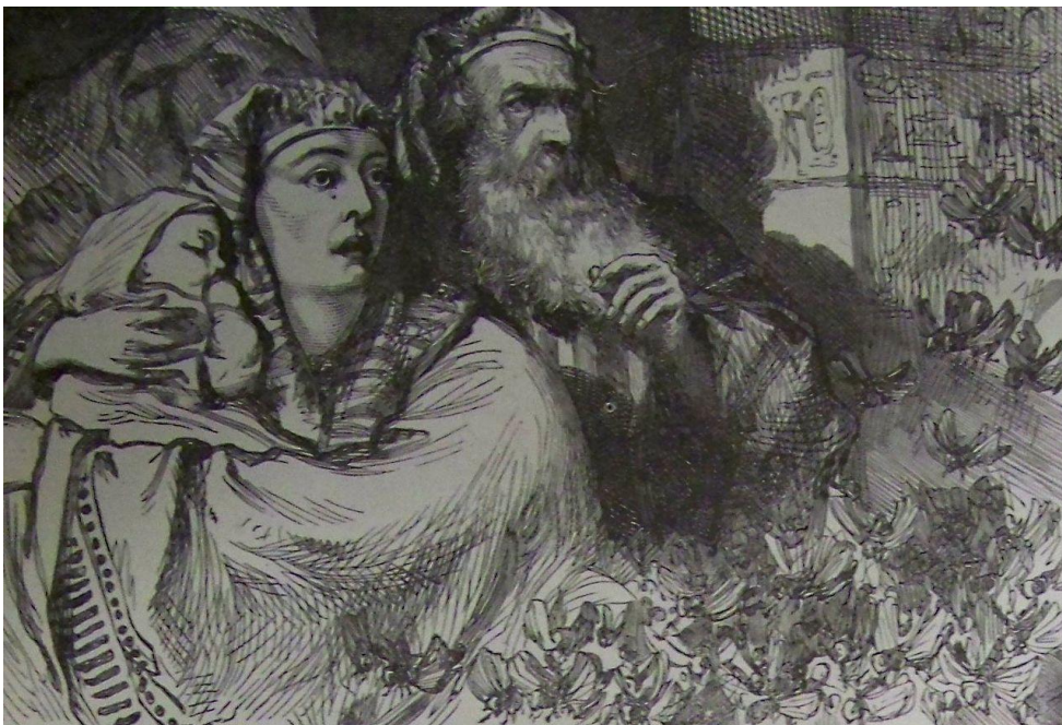
Negende plaag: drie dagen diepe duisternis in heel Egypte

De Egyptenaren zaten bang en weggekropen in hun huizen. Ze konden elkaar niet meer zien. En naar buiten gaan durfden ze helemaal niet. Er werd niet meer gewerkt. Het eten werd niet meer klaargemaakt. Ze waren de tel van de uren kwijt. Alsof de tijd stilstond, zo langzaam gingen de dagen voorbij. Was dit het einde van de wereld?