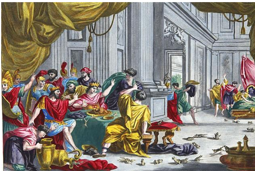
Het werd een zware plaag, al die kikkers...

’s Nachts kon hij er niet van slapen en zijn vrouwen in zijn harem waren allemaal overstuur. De kleine prinsen en prinsessen huilden dag en nacht. Soms, wanneer de Farao op zijn troon zat, sprongen ze over zijn voeten en als hij liep, dan trapte hij erop. En zoals het in zijn paleis was, zo was het in alle huizen in heel Egypte.