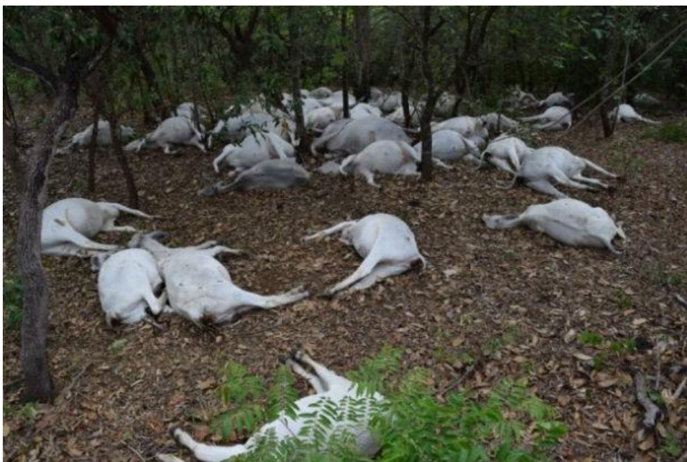
Bijna alle dieren in Egypte stierven...

De volgende dag begon het. Duizenden dieren stierven. De paarden lagen dood in de grote stallen van de Farao, maar ook de geit in de hut van de arme man. De ezel van de kleine koopman stierf, net zoals kamelen van de rijken. Alle dieren, de koeien, schapen en geiten, ze gingen allemaal dood. Het was een ramp voor Egypte en het zou jaren en jaren duren, voordat het verlies weer hersteld was.