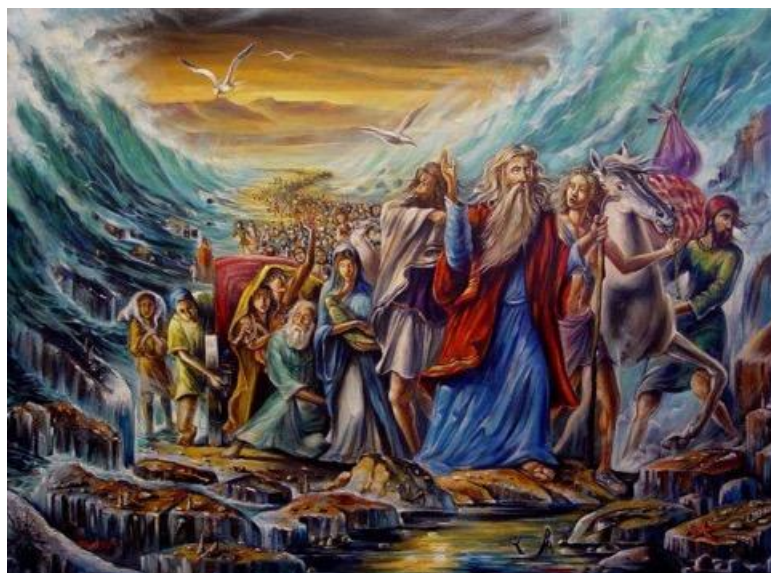
Over de bodem van de zee liepen ze naar de overkant.

Heel die lange nacht duurde die vreemde mars dwars door de zee. Uur na uur liepen ze maar over bodem van de zee naar de overkant. Al die duizenden, stam bij stam, geslacht bij geslacht en familie bij familie. Sterke jonge kerels en kleine kinderen. Moeders met hun baby's in hun armen, oud en jong, niemand bleef achter. Als laatsten kwamen de herders met hun koeien, schapen en geiten. Niemand was meer bang. Wel waren er veel mensen die zich schaamden voor hun gedrag van die middag, voor hun opstandige woorden, voor hun ongeloof en geen vertrouwen hebben in wat Mozes in Naam van God tegen hen gezegd had. En aan beide kanten van dat brede pad stond die donkere, glinsterende muur van water. Als die stormwind nu plotseling stil zou vallen? Ja, dan zouden de golven over hen heen komen en zouden ze allemaal verdrinken.... Maar ze wisten dat het zou blijven stormen, net zolang tot de Godsman Mozes weer met zijn staf zou zwaaien.