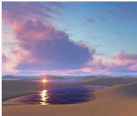
Plotseling zagen ze het schitteren van water.

Toen het leek alsof er nooit een einde aan deze eindeloos lange reis zou komen en al het drinkwater op was, begonnen ze te mopperen. In Egypte was het beter dan hier in de woestijn. Het werk was daar zwaar geweest en de slavendrijvers wreed, maar daar was volop water geweest. Drinken! O, wat hadden ze allemaal een dorst. Alles hadden ze wel willen geven voor één slok water. Maar nergens was water in deze brandende hel! En Mozes? Nu, die liep daar maar alsof hij geen dorst had en geen moeheid kende. Maar Mozes was ook geen gewoon mens. Daar kon je geen rekening mee houden!