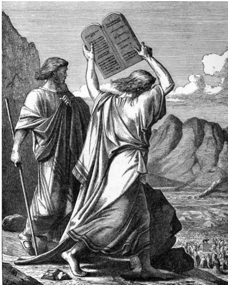
Mozes gooide de beide stenen tafels van God kapot tegen het graniet van de berg.

Een ogenblik stond Mozes daar roerloos, als aan de grond vastgenageld. Het voelde alsof hij nooit weer een voet zou verzetten. Hij zag het voor zich, maar kon het niet geloven! Was dit een bange droom? Zou hij zo dadelijk wakker worden in zijn eigen tent of bij God in de donkere wolk? Weer hoorde hij de geluiden van de harp, de citer en de rinkelbel. Opnieuw zag hij dat gouden kalf, een vlam in de gloeiende zon. Een hevige, wilde toorn nam bezit van Mozes. En in een erge driftbui gooide hij de beide stenen tafels van God kapot tegen het graniet van de berg. Hij dacht er niet meer aan dat hij ze van God moest bewaren. Dat de Heer ze zelf geschreven had en dat hij ze niet zomaar mocht breken! Mozes dacht alleen nog maar: dit is Gods volk niet meer . Deze dansende, heidense bende, heeft Gods heilige Woorden niet meer nodig!