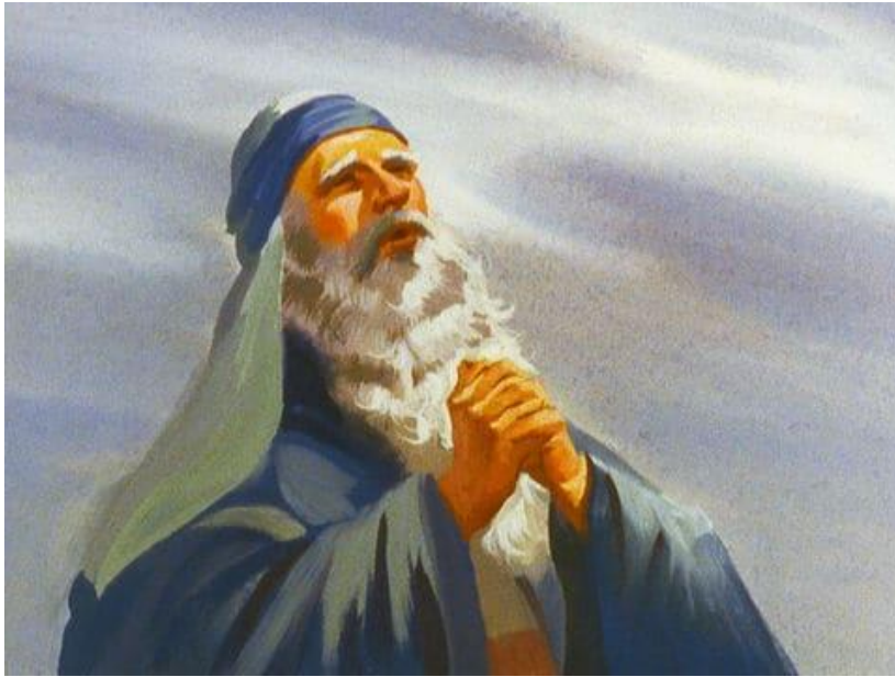
Mozes bidt tot God.

verdwijnen!’ Dat wilt U toch niet? Wees toch niet boos meer. Doe Uw volk toch geen kwaad! Denk aan Uw dienaren Abraham, Izaäk en Jacob. U heeft hen plechtig beloofd om hun zoveel nakomelingen te geven als er sterren aan de hemel zijn. En het land dat U hun beloofde, zou U voor altijd aan die nakomelingen geven.’