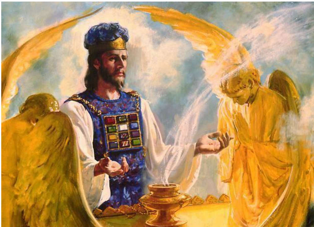
De hogepriester in het Heilige der Heiligen.

Geen wonder dat het volk hoog tegen de hogepriester opkeek. Wanneer hij naar de Tabernakel ging, in zijn blauw en wit gekleurde kleren en met de twaalf edelstenen op zijn borst en aan zijn muts een gouden plaat, waarop stond: 'Heilig voor de Heer', dan werden alle mensen stil en keken met veel ontzag naar hun hogepriester!