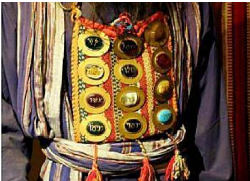
Een soort schort, waar twaalf edelstenen op genaaid waren.

Je kon ook zien dat hogepriester Aäron in dienst van het hele volk stond. Op zijn borst droeg hij een schild, een soort schort, waar twaalf edelstenen op genaaid waren. Voor elke stam van Israël één, met de namen van Jacobs twaalf zonen erop. Zo droeg de hogepriester de namen van Israëls kinderen op zijn hart, zoals vaders en moeders hun kinderen die zij van God gekregen hebben, liefhebben en in hun harten dragen.