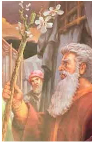
De staf van Aäron.

Maar jullie hebben Mijn Naam niet eens genoemd! De staf van Aäron, die gebloeid heeft, had Ik jullie meegegeven als teken van Mijn Macht.