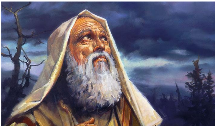
Abraham, de vriend van God.

Wonderbaarlijk blij was Abram. Vijfentwintig lange jaren had hij moeten wachten en nu hij dacht dat het niet meer kon, nu zou het gebeuren. Abram hield heel veel van Ismael. Maar een zoon van Sara en hem, dat was toch iets anders. En wat zou Sara nu zeggen? Zou ze veel spijt krijgen dat ze toen met haar slavin Hagar haar zin doorgedreven had?