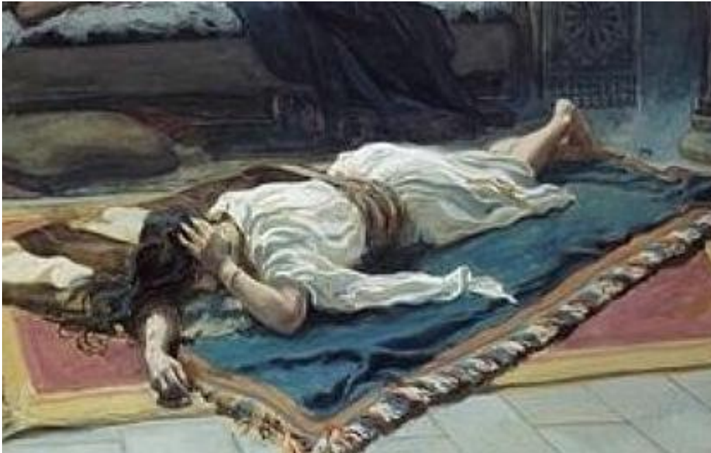
David begon te bidden.

Alles vertelde hij aan God de Heer. Niets hield hij achter. Vanuit het diepst van zijn hart smeekte hij om het leven van zijn zoontje.