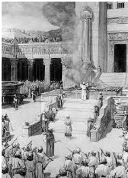
Koning Asa vernieuwde het verbond met de Heer.

Na die overwinning kwam er een profeet bij koning Asa en beloofde hem dat de Heer hem zou blijven zegenen, als hij zich aan de wet van Mozes bleef houden en in 's Heren wegen bleef gaan.