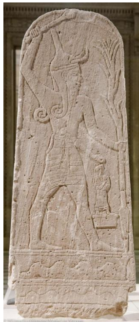
Een gewijde steen voor Baäl

Alle mensen moesten van hem verplicht naar de tempels in Bethel en Dan gaan om daar de afgoden offers te brengen. Koning Achab trouwde met de heidense vrouw Izébel, de dochter van Eth-Baäl, de koning van de Sidoniërs. Voordat hij met haar trouwde ging hij naar haar toe en bracht offers in de grote Baältempel in Tyrus. Later, toen de jonge prinses zijn vrouw was en bij hem in zijn paleis woonde, bouwde hij speciaal voor haar een Baältempel in zijn hoofdstad Samaria. Bij dat altaar hoorde een masséba, een gewijde steen voor Baäl en het kon natuurlijk ook niet zonder een Asjera, een houten beeld voor de godin Astarte.