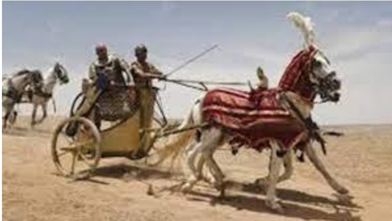
Koning Achab in zijn strijdwagen, onherkenbaar voor zijn vijand.

De soldaten van koning Hadadëzer deden hun uiterste best om op het slagveld koning Achab te vinden. Maar hoe ze ook zochten, ze konden hem nergens ontdekken. Waar zat hij toch, die zoon van Omri en waar was zijn koningswagen, die ze nog heel goed kenden van toen ze samen streden?