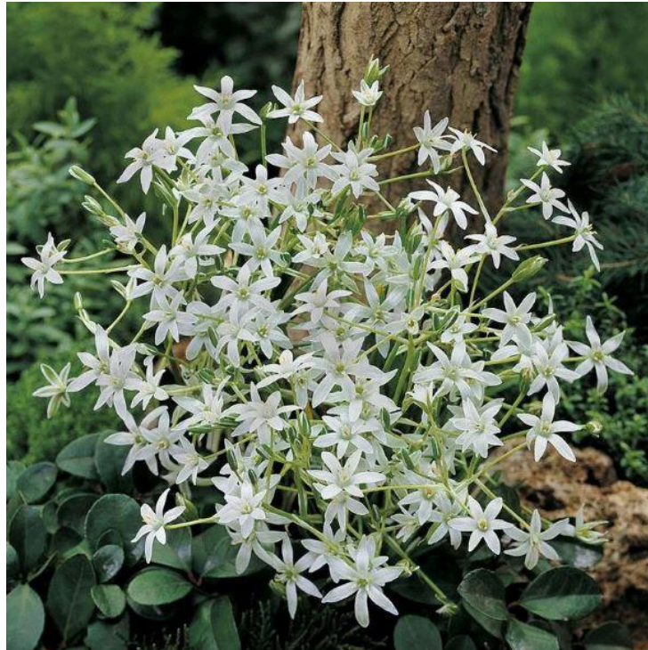
Het plantje vogelmelk.

koning, waren ook al geslacht. Het was een hard gelag om dit onrein vlees te eten. Maar nood breekt wetten. Sommige mensen slachtten zelfs hun ezels. Maar die waren er niet veel en tenslotte konden alleen nog de heel rijke mensen vlees betalen. Er kwam een dag dat een ezelskop - en daar zit beslist niet veel vlees aan - verkocht werd voor tachtig sjekel zilver en voor een pond duivenpoep, zoals het plantje vogelmelk ook wel wordt genoemd, zelfs vijf sjekel. Dat was natuurlijk helemaal geen normaal voedsel, maar ze gebruikten het toch, misschien wel in plaats van zout.