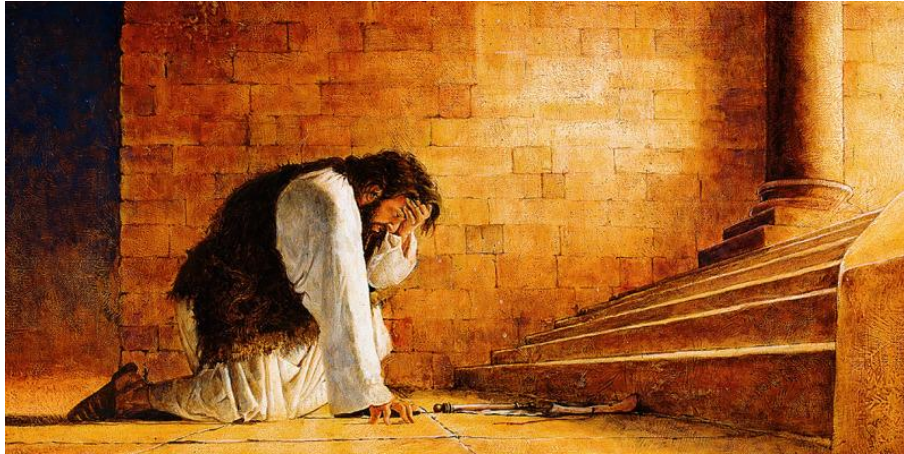
In de tempel stortte Hizkia zijn hart uit voor de Heer.

Ook hij scheurde zijn kleren en met een rouwdoek om zijn heupen ging hij naar de tempel en stortte zijn hart voor de Heer uit.