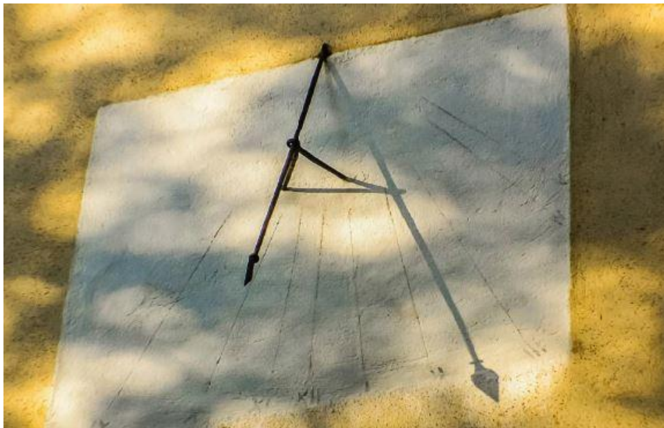
De zonnwijzer van koning Hizkia.

Hizkia antwoordde: ‘Laat de schaduw maar tien graden achteruit gaan.’ Diezelfde dag nog gebeurde dit machtig teken. Het was al laat in de middag en de schaduwen werden al lang, Op de zonnwijzer viel de schaduw al bijna helemaal onderaan. Toen was het alsof de Here God de zon terugplaatste aan de blauwe hemel en de schaduw op de zonnwijzer liep tien graden terug. De mensen in Jeruzalem begrepen maar niet, waarom deze dag zo vreselijk lang duurde.