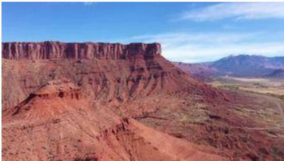
Rots van Rimmon.

In het begin waren de mannen van Israël erg blij geweest met de overwinning. Maar nu de woeste strijd voorbij was en hun wraak gekoeld, begonnen ze na te denken. Het was goed dat die Sodommannen in Gibeon gedood waren en ook de stamoudsten van Benjamin, die moedwillig de oorlog waren begonnen. Maar was het wel goed geweest dat zij bijna de hele stam hadden uitgeroeid? Op die rots van Rimmon leefden nog wel die zeshonderd soldaten. Maar zonder een vrouw voor elke man zou de stam van Benjamin uitsterven. Hadden ze die strenge eed maar nooit afgelegd. Nooit weer mochten ze een dochter uithuwelijken aan een Benjaminit. En een eed breken die ze plechtig gezworen hadden bij de ark des Heren, naast het rokend altaar? Nee, dat kon niet!