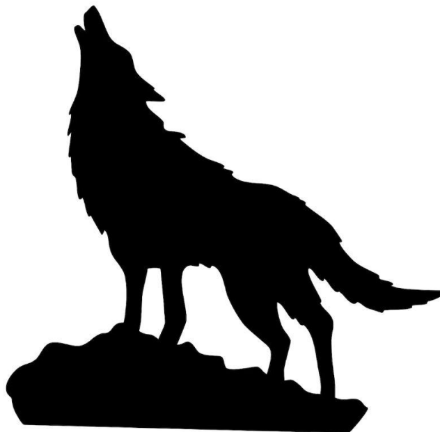
Een hongerige wolf.

In onze trouwbijbel staat in Genesis 49 : 27 Benjamin is een verscheurende wolf. In de ‘Bijbel in Gewone Taal’ is de vertaling van deze tekst: Benjamin, jij bent zo hongerig als een wolf. Een wolf die elke dag op zoek is naar dieren, die hij kan grijpen.