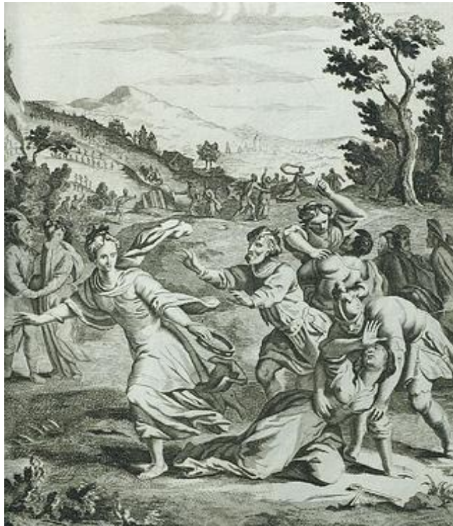
De Benjaminiten schaken de jonge meisjes van de stad Silo.

En zo is het gebeurd. Op de dag dat de jonge meisjes van Silo al dansend door de stadspoort naar het wijde veld buiten de stad liepen, werden zij tussen de wijngaarden geschaakt door de Benjaminiten. Met de mannen gingen ze mee naar het woongebied van de stam Benjamin. Daar trouwden ze, gingen in een huis wonen, bewerkten het land en kregen kinderen. Zo bleven er toch nog twaalf stammen in het land Israël.