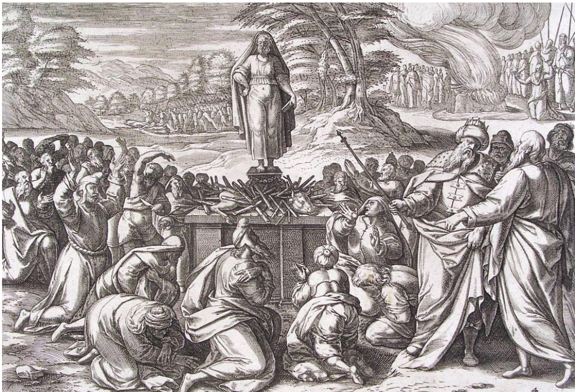
Overal in het land rookten de altaars voor de afgod Baäl.

Bijna niemand ging meer naar de heilige feesten in Silo. Maar tijdens de zwoele zomernachten vierden de jongelui hun wilde feesten ter ere van Astarte. De offerdiensten aan de Baäls was al erg, maar wat er tijdens die nachten onder donker ruisende bomen gebeurde, was nog veel erger. Het hele land werd er door ontheiligd.