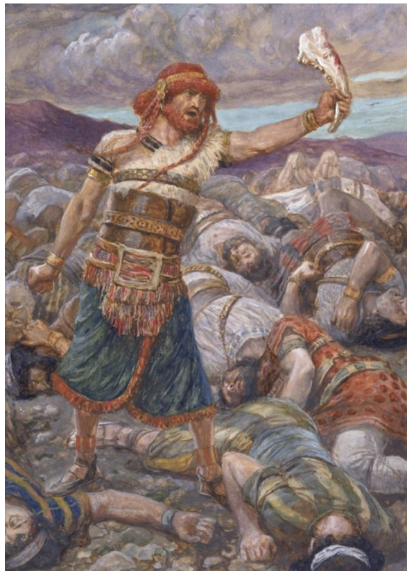
Om hem heen lagen de dode Filistijnen.

O God, nu maakte hij een begin. Simson hield niet eerder op met vechten tot de laatste Filistijn gevluht was. Om hem heen lagen de dode Filistijnen. Wel meer dan duizend.