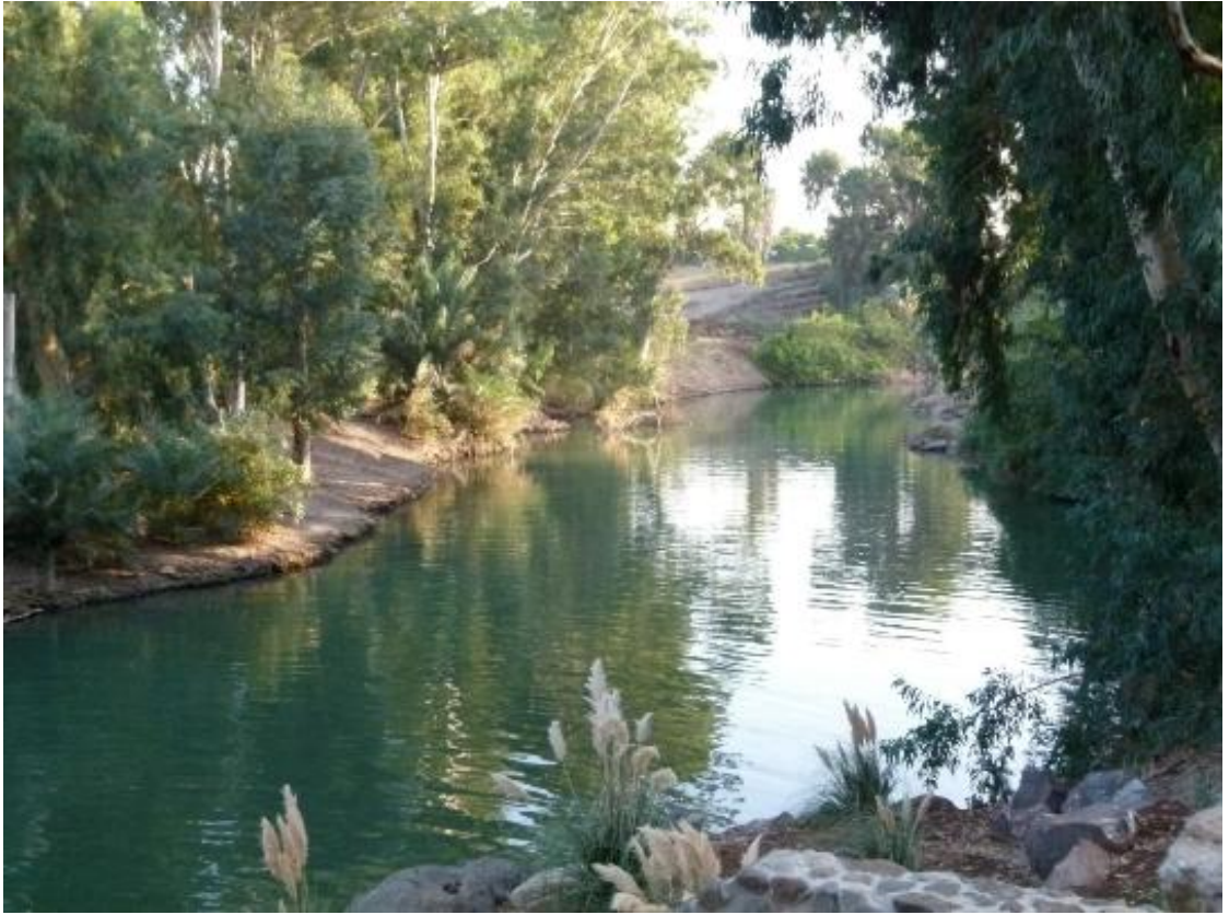
Een rivier in het land Israël.