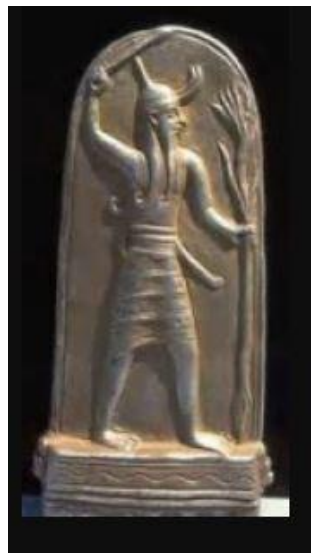
Dagon, de god van de Filistijnen.

Zo stond dan de ark van God in de tempel van Dagon in de stad Asdod: een smalle gouden kist voor het machtig grote Dagonbeeld. Nog nooit waren de priesters zo trots geweest als die middag, toen de ark in hun tempel binnengebracht werd. En daar hadden ze alle reden voor: Hun god Dagon was nog sterker dan die machtige God van Israël. Hij had hem overwonnen!