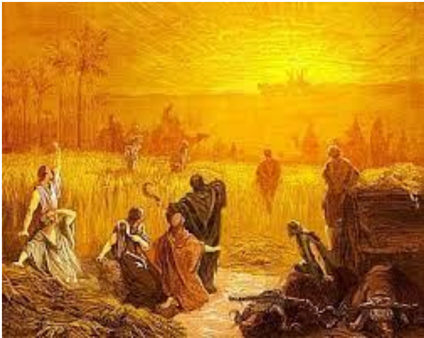
Inwoners van de stad Beth-Semes

De inwoners van Beth-Semes durfden de ark niet langer te houden. Ze vroegen de mensen van Kirjath-Jearim om de ark bij hen vandaan op te halen. En zo kwam de ark in het huis van Abinadab, waar hij lange jaren heeft gestaan.