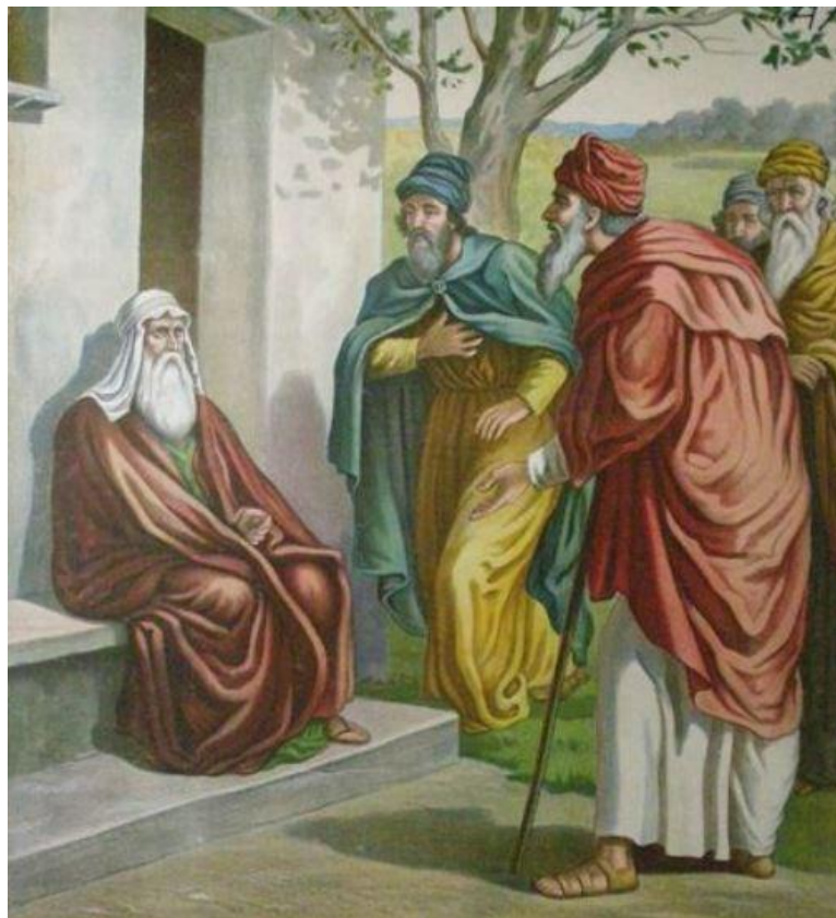
Het volk vraagt om een koning

‘Zo kan het niet langer,’ zeiden ze. ‘U bent oud en uw zonen leven niet zoals u. Ze laten zich omkopen om oneerlijk recht te spreken. Wij willen dat u een koning voor ons uitzoekt, net zoals de andere volken om ons heen ook hebben.’