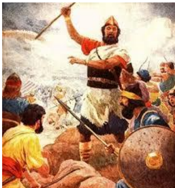
Koning Saul stak zijn speer omhoog.

En met veel geschreeuw vielen ze de vijand in de flank aan.