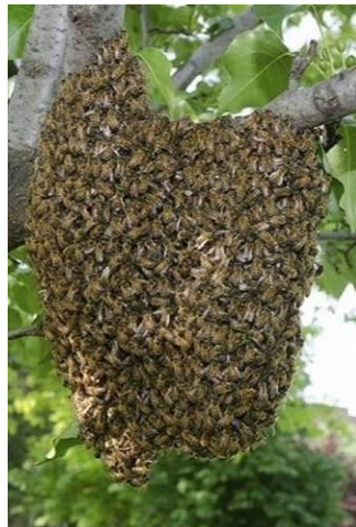
Een bijenzwerm hangt aan de tak van een boom.

Niet dat hij moest rusten, maar hij had wel trek in eten. Ze waren nu in een bos en hij zag bijenzwermen in de bomen hangen. Al lopende stak hij zijn speer in een bijenvolk. Hij kon zo de honing van de speer afeten. Hij voelde dat dit eten hem goed deed. Nieuwe krachten kwamen in zijn vermoeide lichaam.