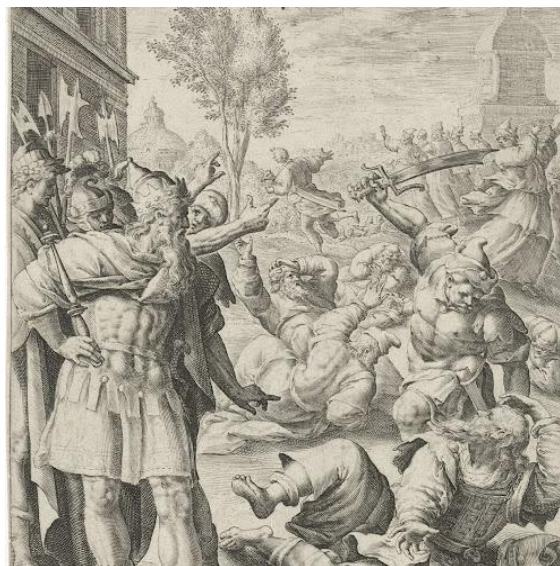
Op bevel van koning Saul doodt Doëg de priesters des Heren.

Toen de vijftientig priesters dood op de grond lagen, was Sauls woede en waanzin nog steeds niet voorbij. Hij stuurde Doëg en zijn mannen naar het stadje Nob en liet hen daar alles wat leefde doden: mannen, vrouwen, kinderen en ook alle dieren. Toen ze ’s avonds naar huis gingen was Nob een dode stad. Geen priester zou meer een gebed tot God uitspreken, geen offer zou hier meer gebracht worden en in het heilige van de tabernakel brandde Gods lamp niet langer.