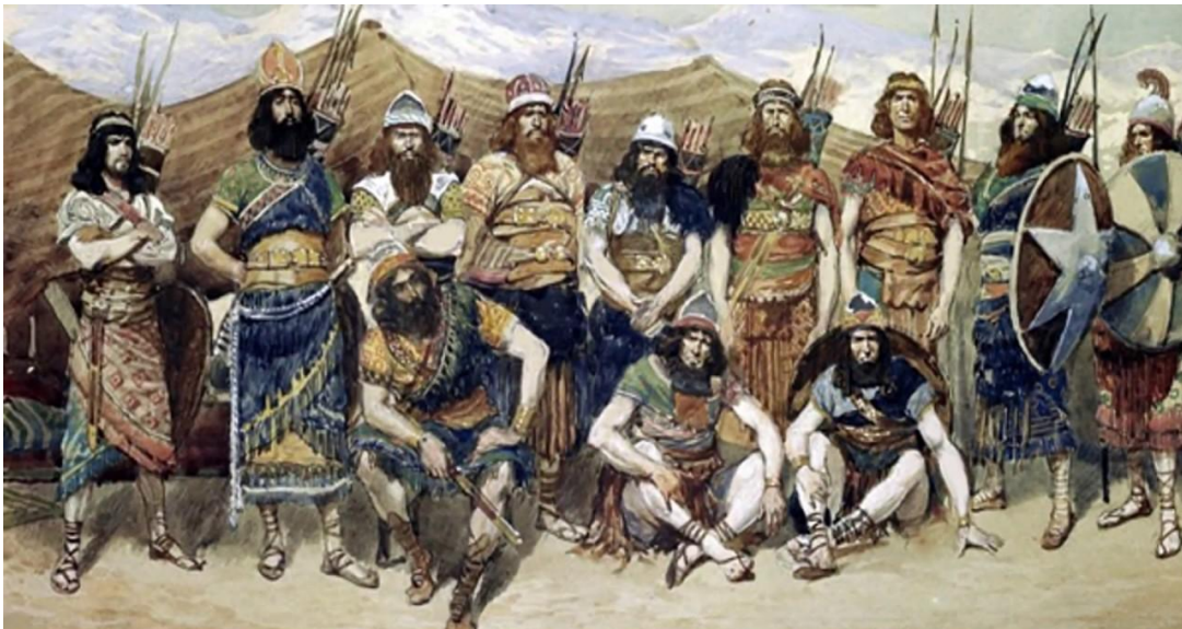
David en zijn soldaten in dienst bij koning Achis.

Koning Achis lachte vriendelijk. ‘Waar de koning van Gath heengaat, daar gaat zijn vriend David met hem mee! En deze keer zul jij met jouw soldaten mijn lijfwacht zijn. Mijn leven vertrouw ik aan jou toe!’