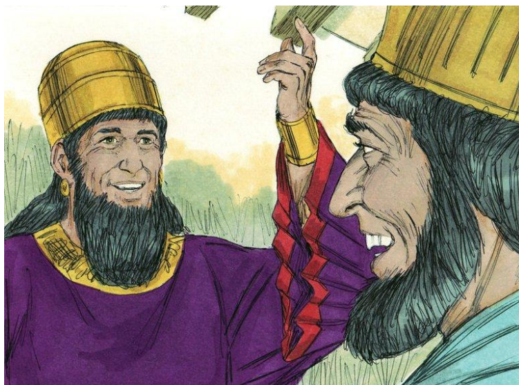
Koning Ahasveros en zijn vriend Haman.

Koning Ahasveros lachte breed. ‘Dat zilver heb ik niet nodig. Dat mag je houden. En wat dat volk betreft, ik vind het goed. Doe maar.’