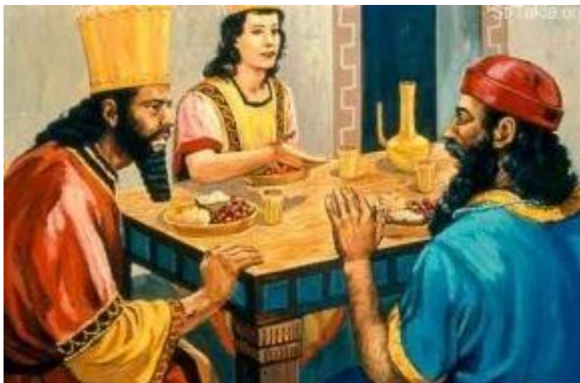
Haman eet bij de koningin aan tafel.