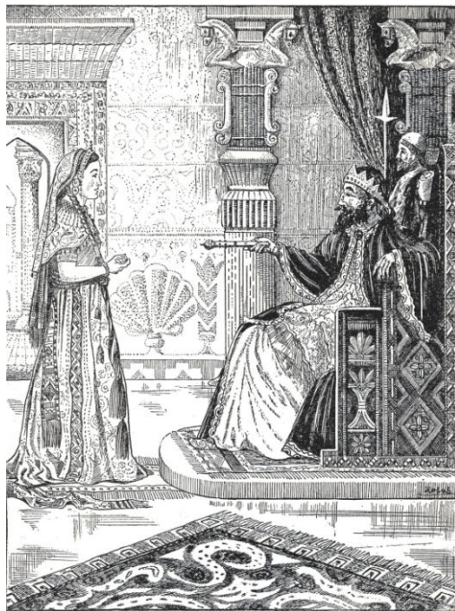
Esther zag dat de hoge heerser glimlachte.

En toen zag Esther dat de hoge heerser glimlachte en haar zijn gouden scepter toestak, Eén seconde stond haar hart stil. Toen bonsde het met felle, blijde slagen. De gouden scepter.... Dus, hij schonk haar het leven!